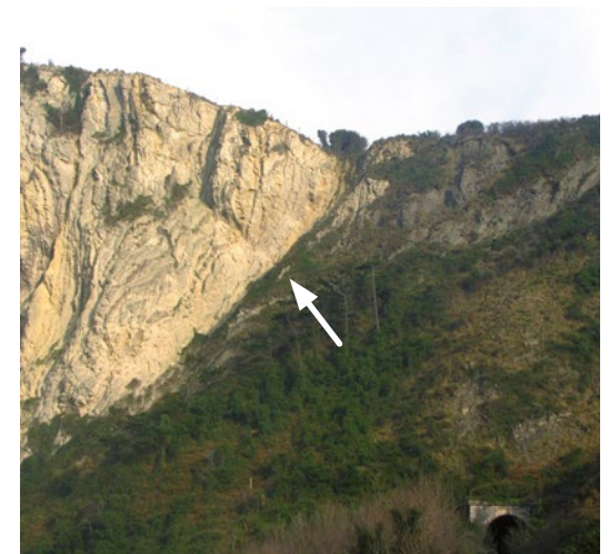
Andutzeko failaren xehetasuna.