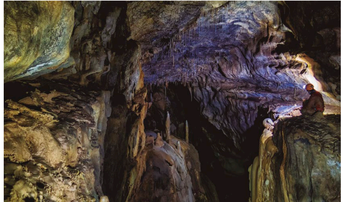
Kobako galeria nagusiaren ikuspegia.

In situ. Sarreratik hurbilen dauden galeriak izan ezik, ez da egokia bisitari-mota guztientzat. Gomen-dagarria da espeleologian nolabaiteko maila eta esperientzia izatea.