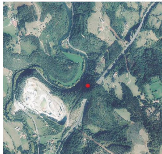
LOCALIZACIÓN UTM 30N: X = 551534 / Y = 4791878 / Z = 68