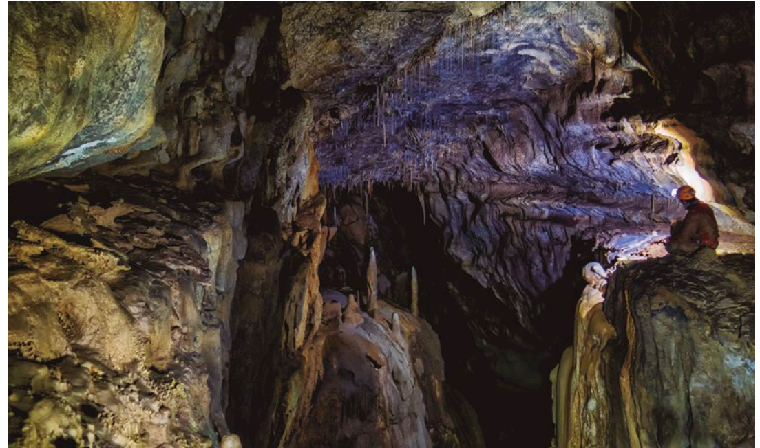
Vista de una de las galerías principales de la cueva.

In situ. Exceptuando las galerías más próximas a su entrada, no es una cueva apta para todo tipo de visitantes en general. Se recomienda cierto nivel y experiencia en la práctica de la espeleología.