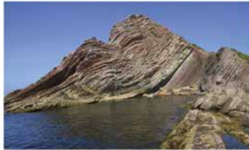
La zona del límite desde el mar.