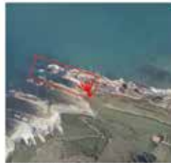
LOCALIZACIÓN UTM 20N: X= 550083 m. / Y= 4754006 m. / Alt.= 0 m.